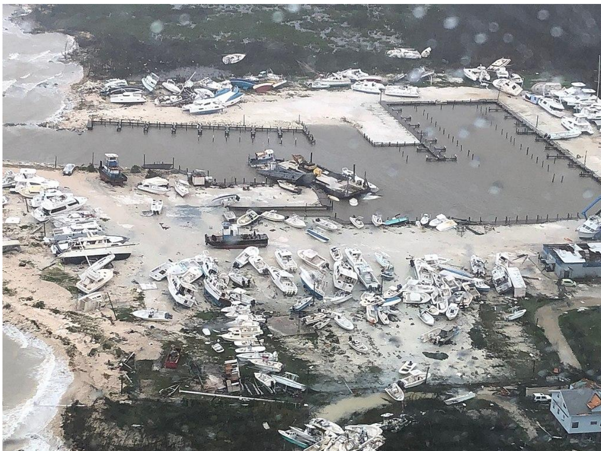
Hurricane Dorian's destruction in the Bahamas

Dorian a frappé les îles Abaco et Grand Bahama, au nord-ouest des Bahamas, le 1 er et le 2 septembre 2019. En raison des lourds dommages causés par cet ouragan, France Diplomatie conseille de limiter les déplacements dans les îles Abaco et Grand Bahama et de faire preuve de la plus grande prudence en cas de déplacement sur ces îles.