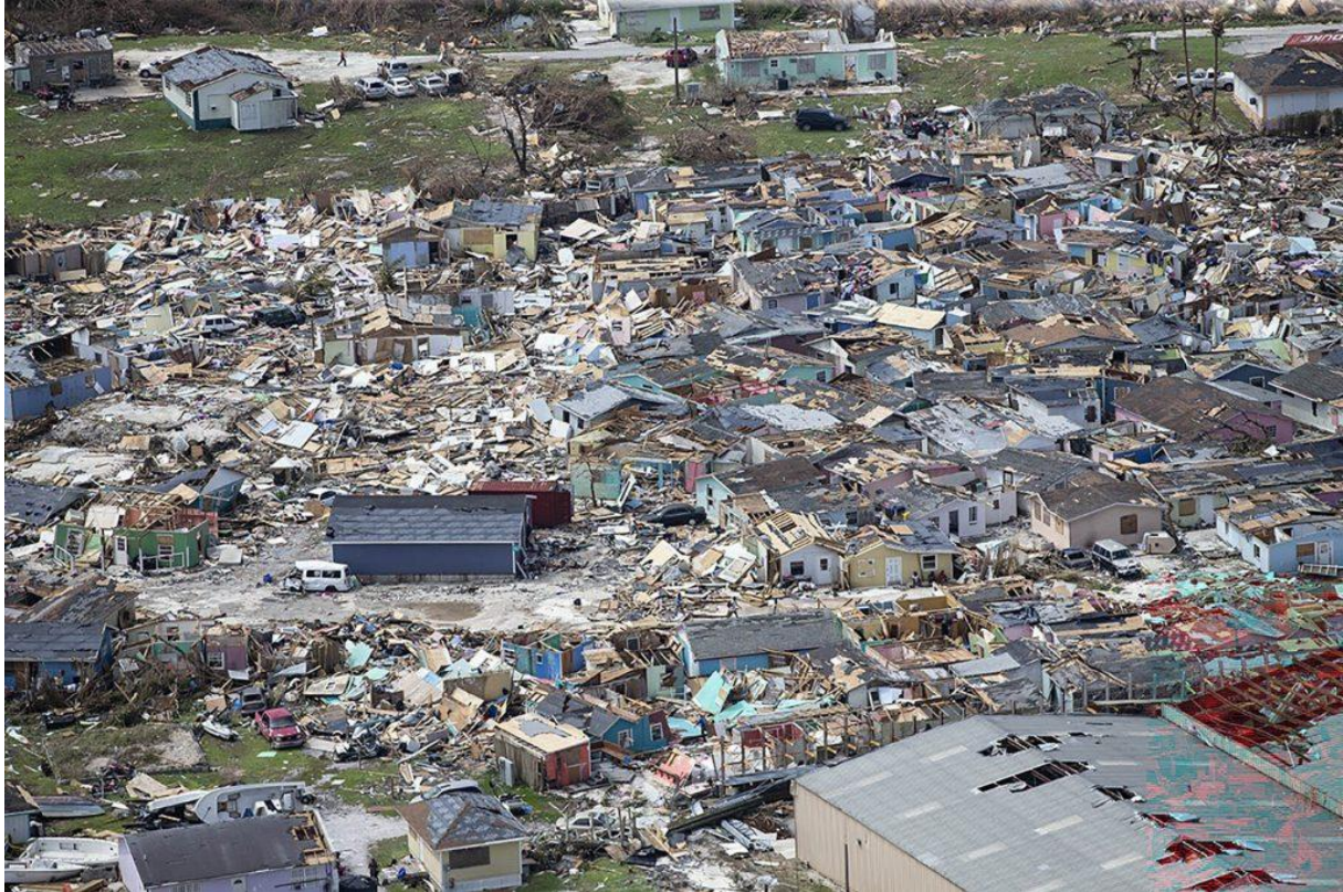
Photo Credit: This photo shows the aftermath of Hurricane Dorian at Marsh Harbour in Great Abaco Island.

Rosie Spinks and Danni Santana , Skift - Sep 06, 2019 1:45 pm