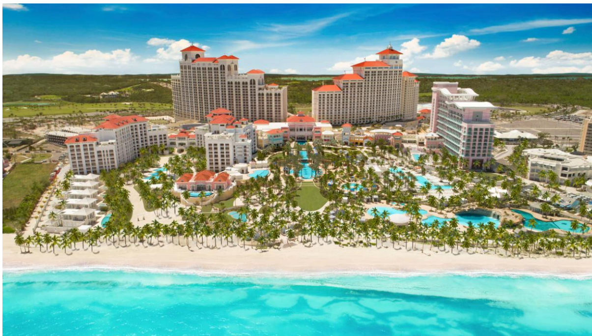
Grand Hyatt Baha Mar

https://www.hyatt.com/en-US/hotel/thebahamas/grand-hyatt-baha-mar/nasgh