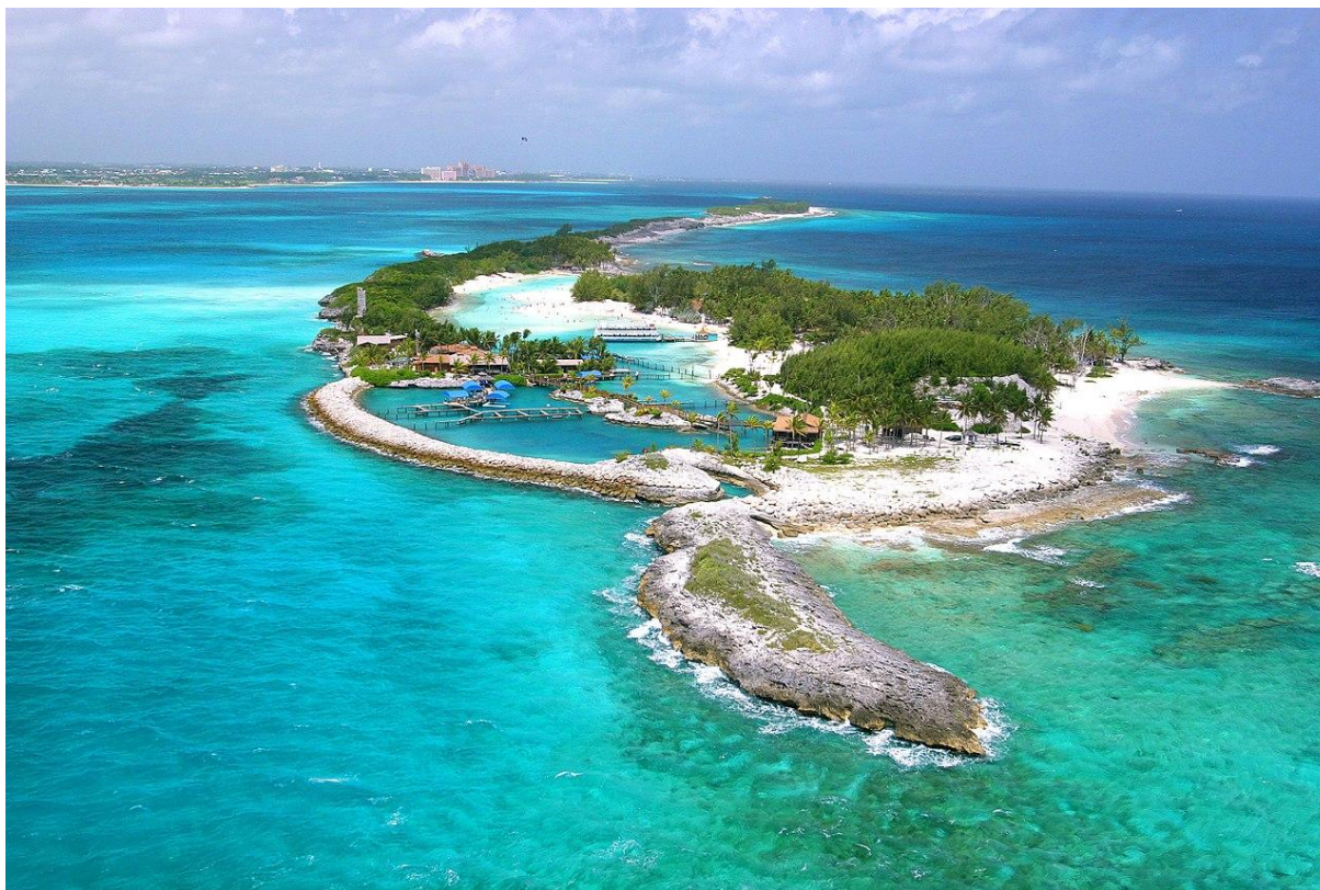
The Blue Lagoon Island, une île privée des Bahamas. Sur la ligne d'horizon, le complexe Atlantis est visible.