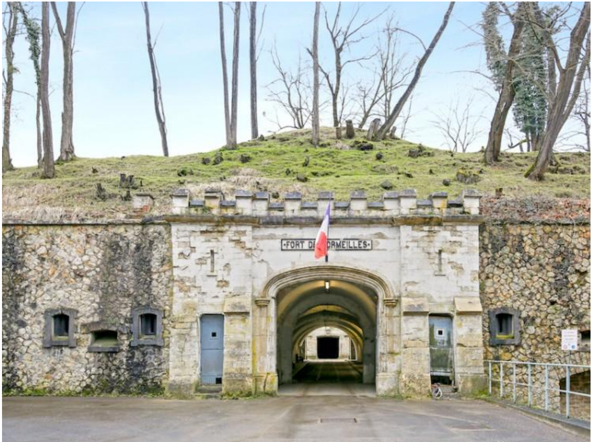
Fort de Cormeilles-en-Parisis, Val-d'Oise