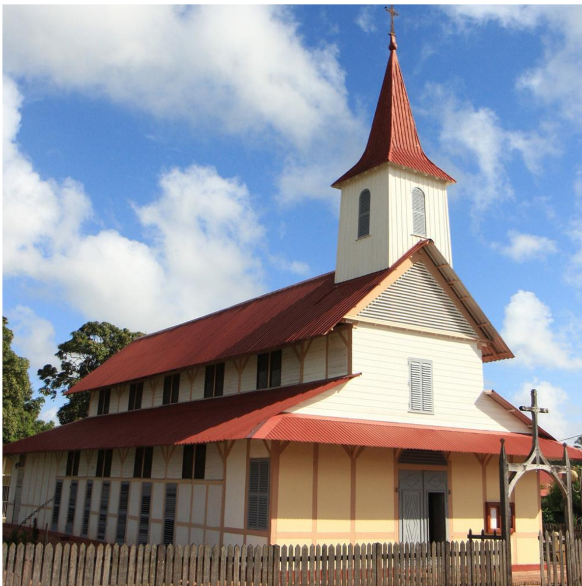
Église Saint-Joseph d'Iracoubo, Guyane

Si des milliers de visiteurs font un détour pour découvrir l'œuvre du bagnard Huguet, beaucoup ignorent l'histoire peu commune de ce bâtiment qui date de la fin du XIX e siècle.