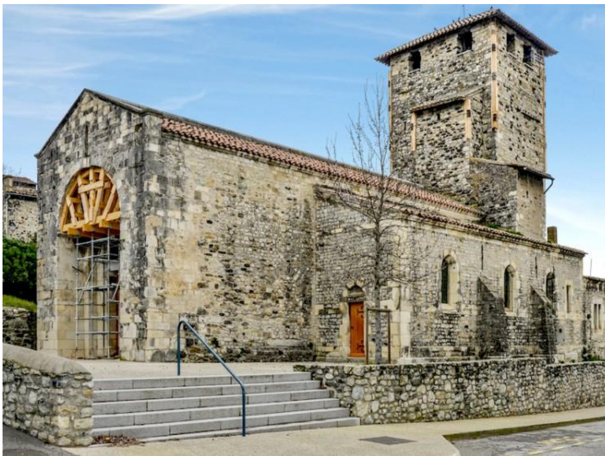
Église Saint-Etienne de Mélas bâtie entre les IX e et XII e siècles au Teil, Ardèche

Album photo: les 18 sites emblématiques de la Mission Bern 2020