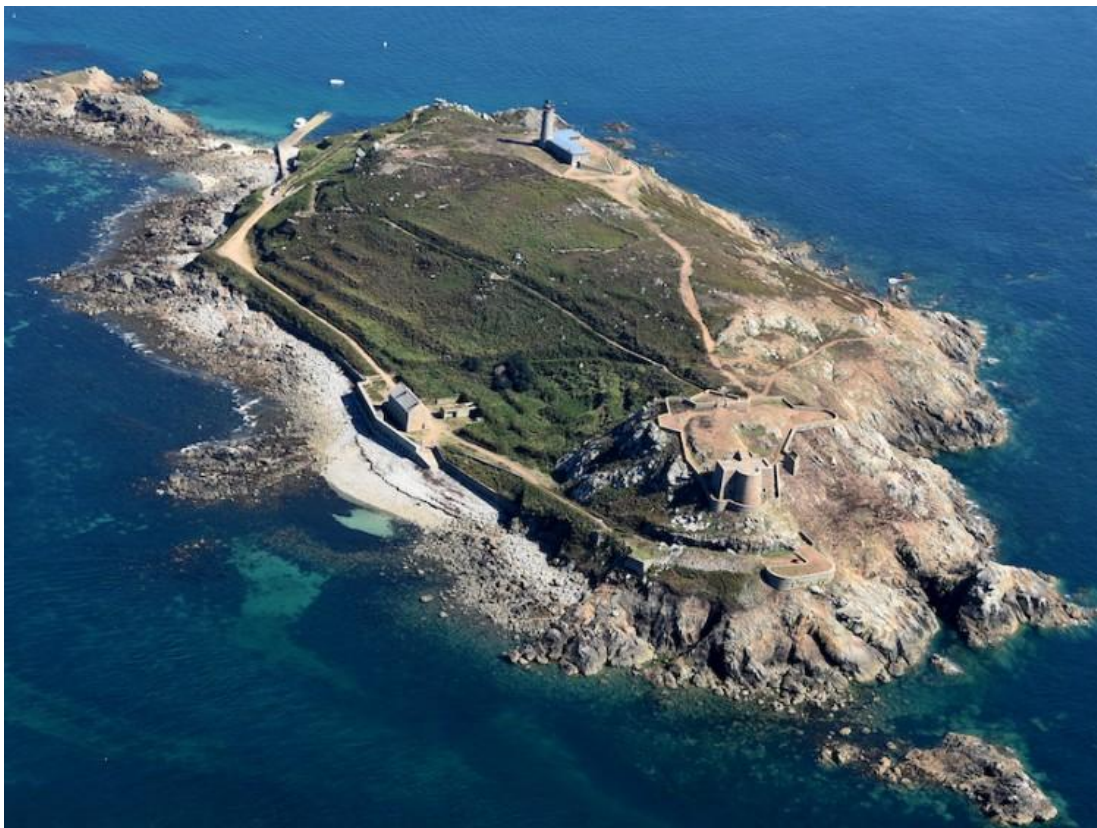
Phare, fort et caserne de l'Île aux Moines, Côtes-d'Armor