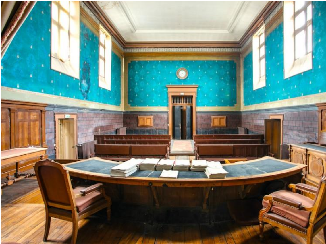
Ancien Tribunal de Baugé-en-Anjou, Maine-et-Loire