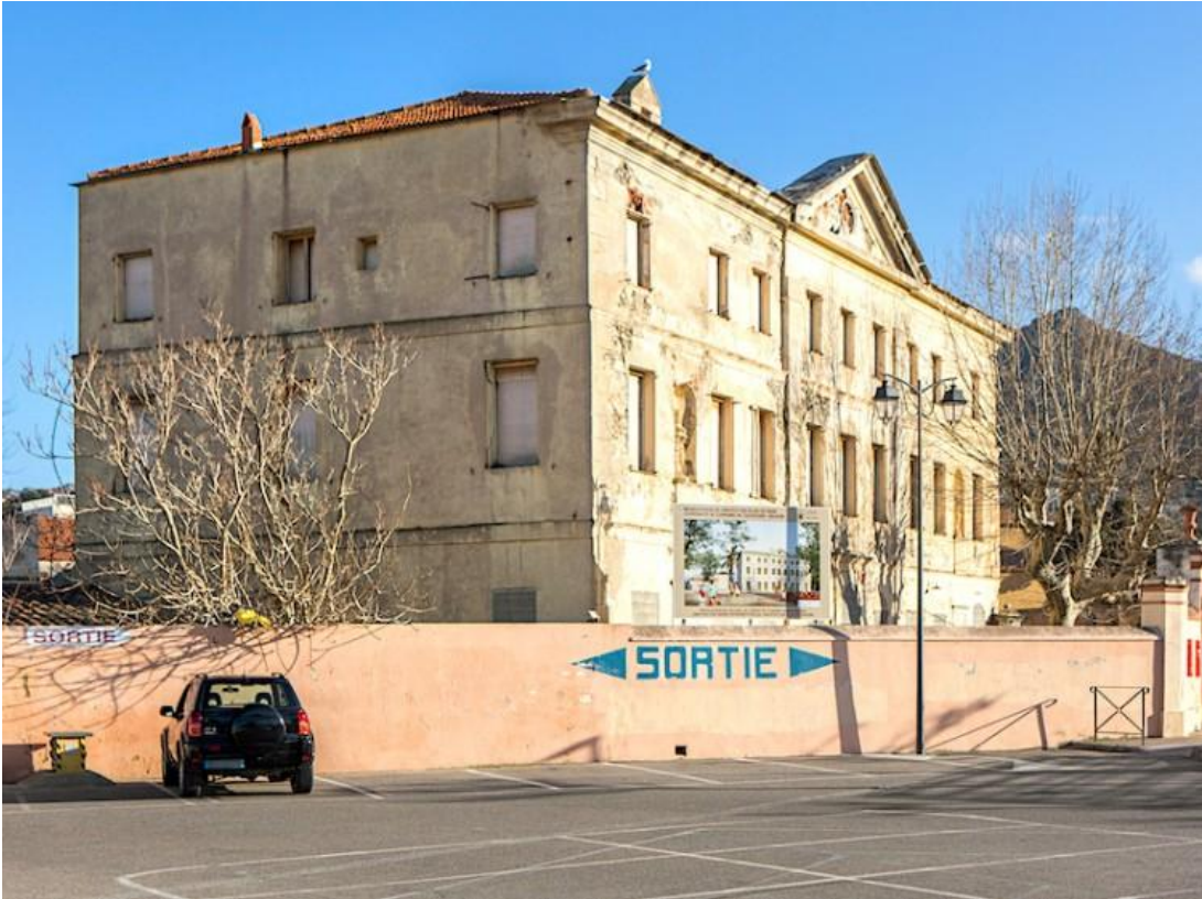
Couvent des Filles de Marie de l'Île Rousse, Haute-Corse