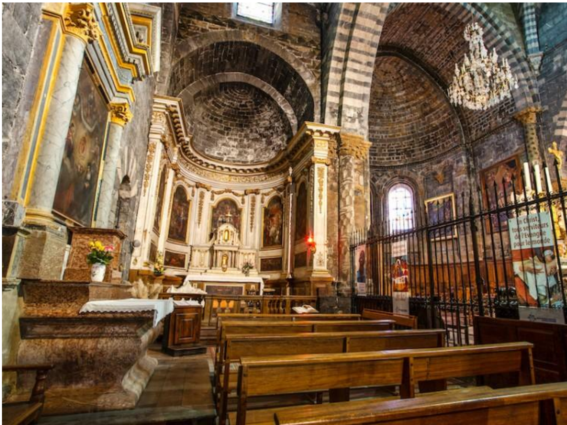
Cathédrale Notre-Dame du Réal à Embrun, Hautes-Alpes