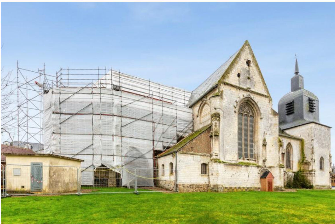
Église Saint-Pierre à Dompierre-sur-Authie, Somme