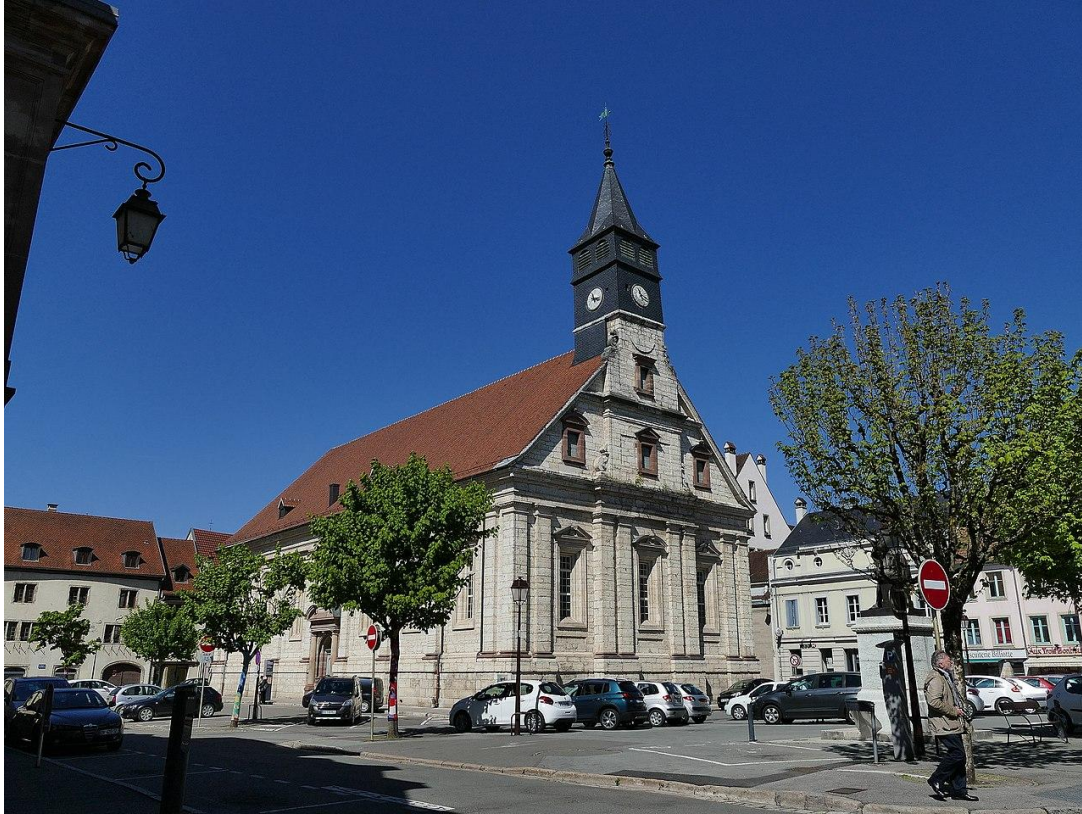
Temple Saint-Martin à Montbéliard, Doubs