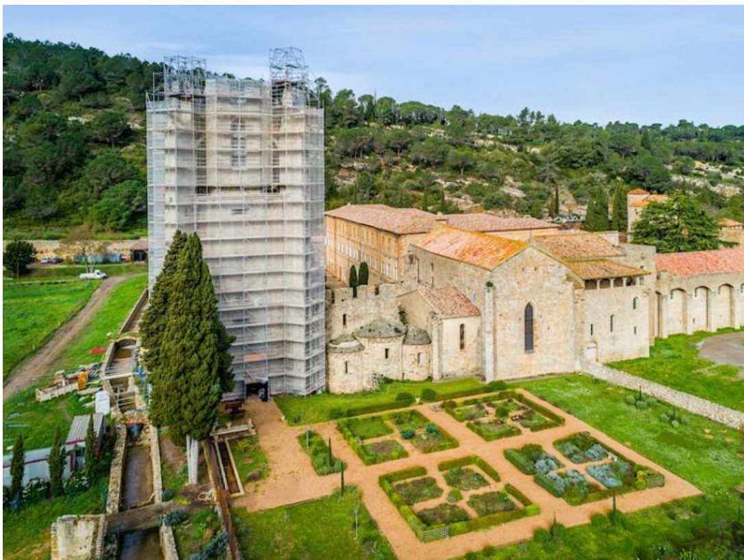
Abbaye Sainte-Marie de Lagrasse, Aude ©OCUS - Fondation du patrimoine