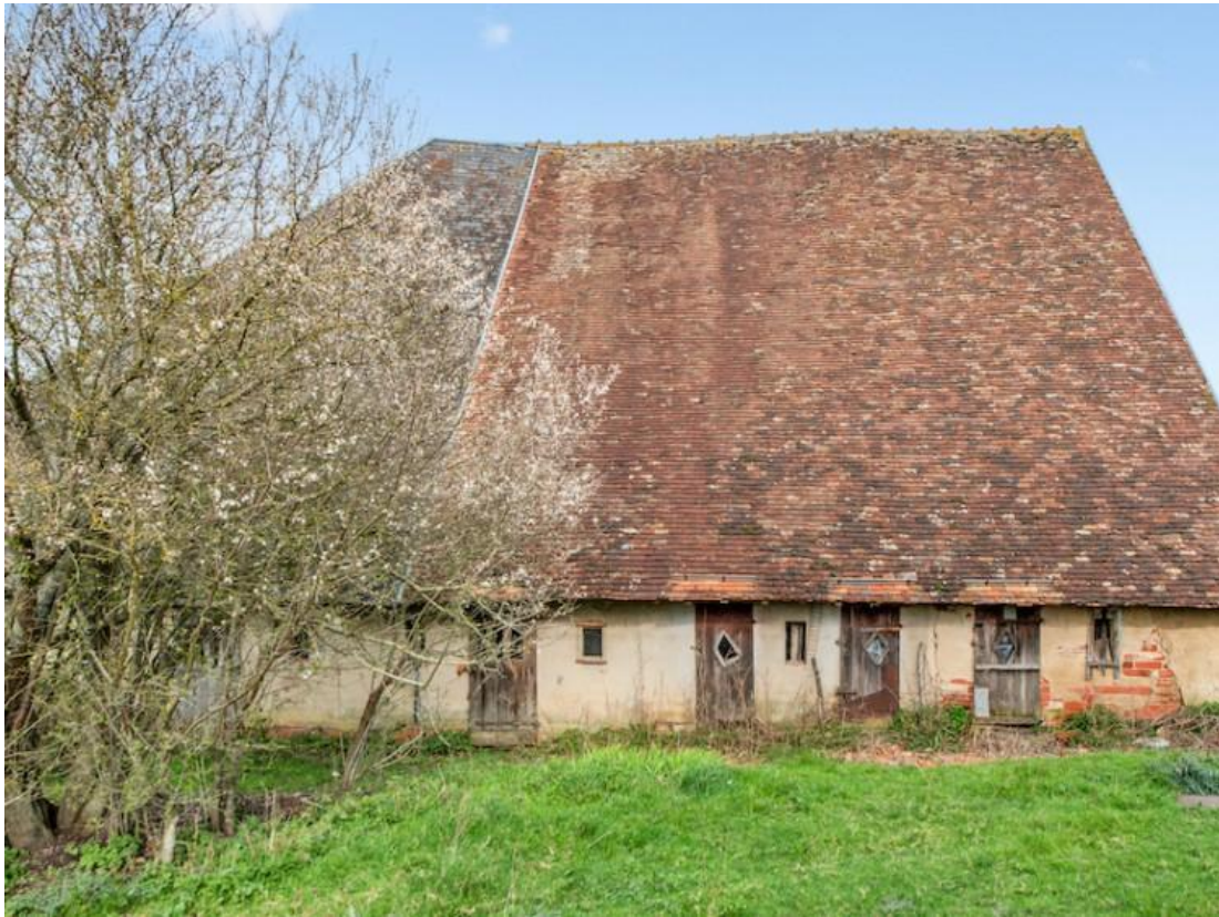
Grange pyramidale de Jars, Cher