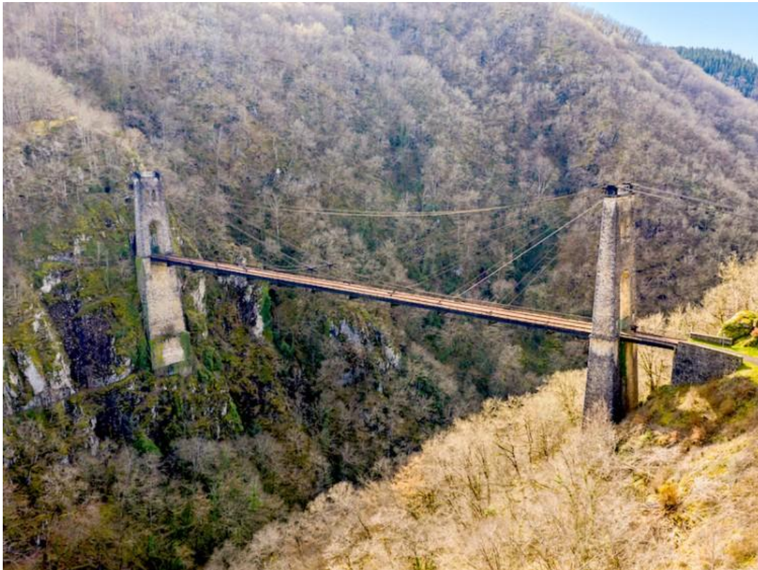
Viaduc des Rochers Noirs, Corrèze