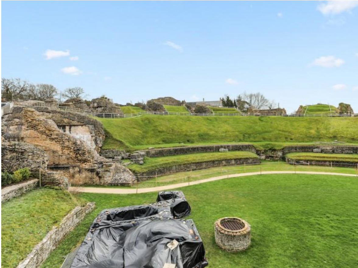
Théâtre romain de Lillebonne, Seine-Maritime