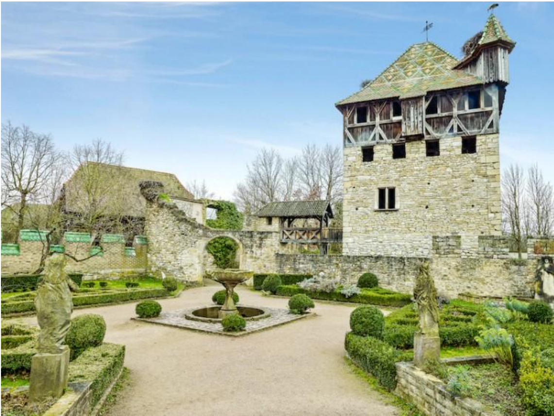
Séchoir à tabac de Lipsheim, Haut-Rhin