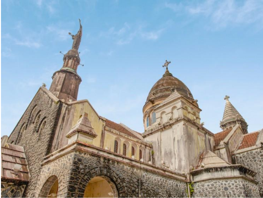
Église du Sacré-Cœur de Balata, Martinique

L' église du Sacré-Cœur de Balata est située au nord de Fort-de-France, dans le département de la Martinique . Appelé aussi le « Montmartre martiniquais », le monument est la réplique au 1/5 ème de la Basilique du Sacré-Cœur de Paris. L'édifice est inscrit au titre des monuments historiques en 2015.