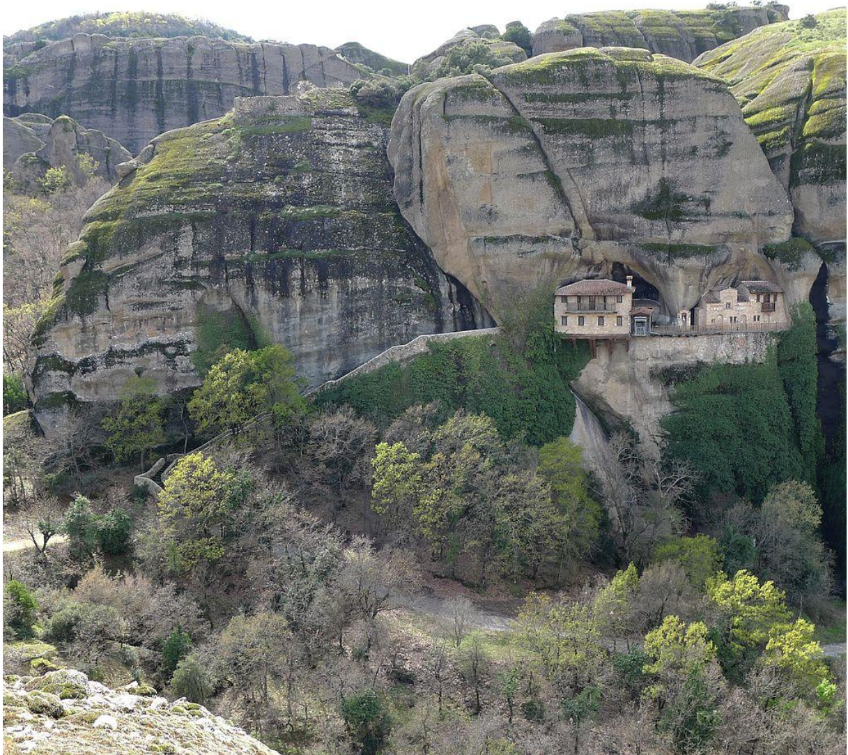
Le monastère d'Ypapantis ou couvent de la Chandeleur

Le monastère d'Ypapantis qui est maintenant ouvert en visite guidée seulement fait partie des monastères des météores, mais ne figure pas dans le circuit touristique des six monastères suspendus. Il est accessible par un sentier depuis le monastère du Grand Météore.