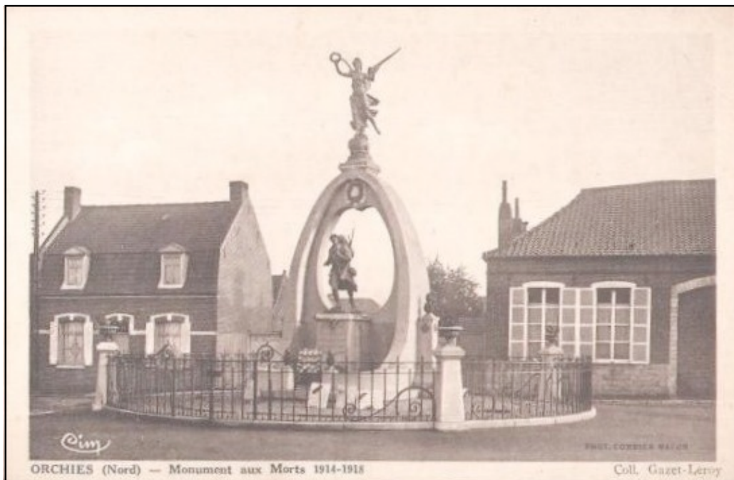
Document 4 : Carte postale représentant le Monument aux Morts d'Orchies (1922)