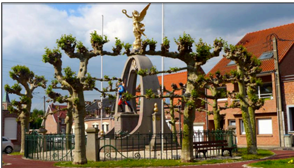
Document 5 : Le Monument aux Morts d'Orchies de nos jours