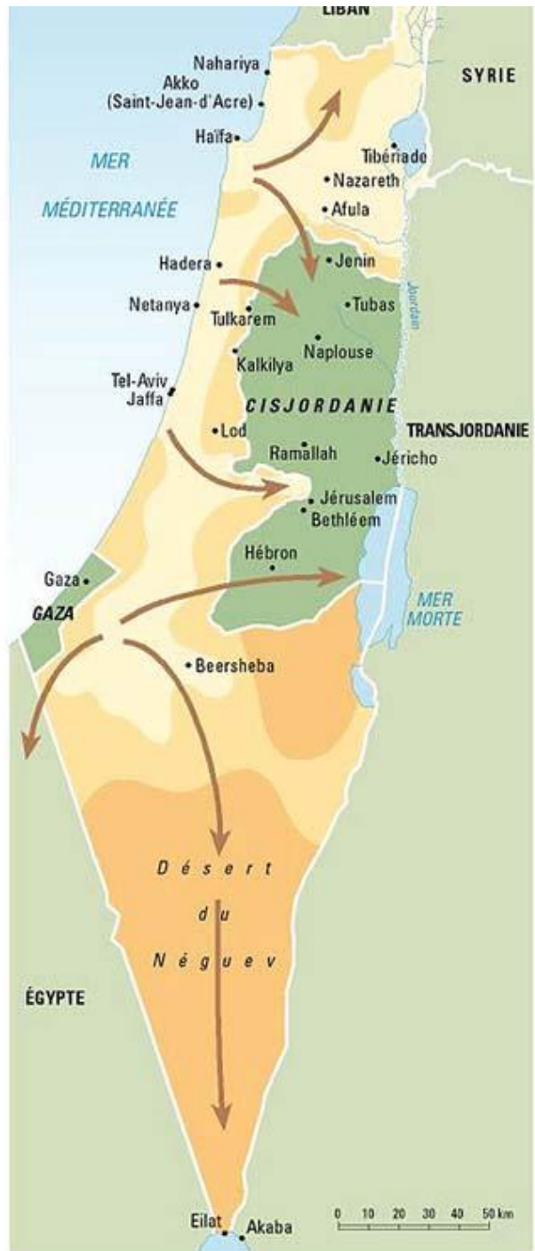
Territoires contrôlés par les israéliens en juin 1948 en novembre 1948 en janvier 1949 Attaques israéliennes à partir de juillet 1948