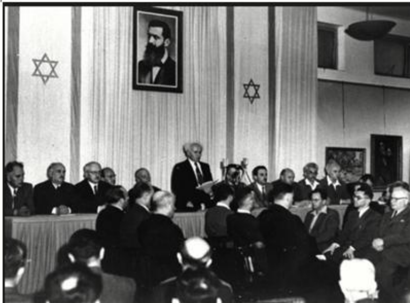
Le discours de Ben Gourion le 14 mai 1948.

Source : Traduction publiée par le ministère israélien des affaires étrangères.