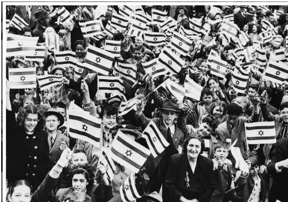
Photo prise en Israël après la déclaration de Ben Gourion, 14 mai 1948.