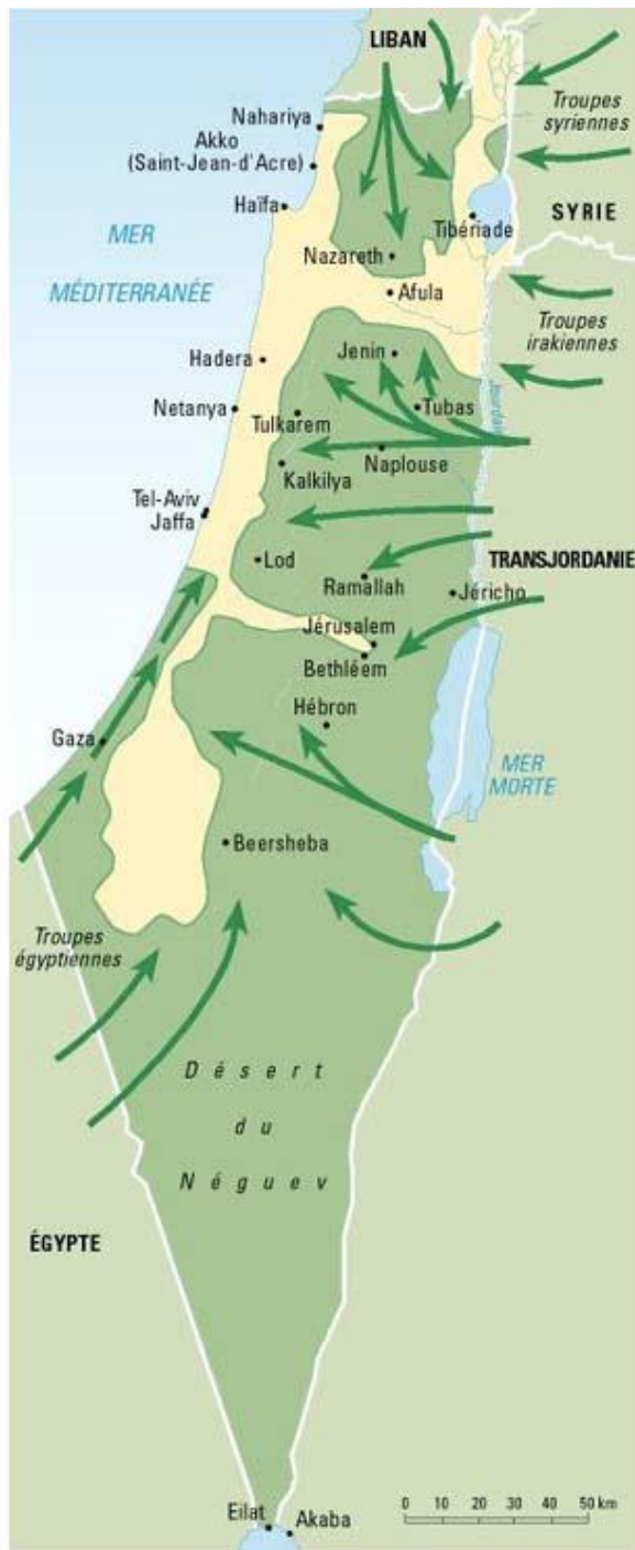
Territoire encore aux mains des israéliens au 1er juin 1948 après les attaques arabes Armées d'invasion arabes