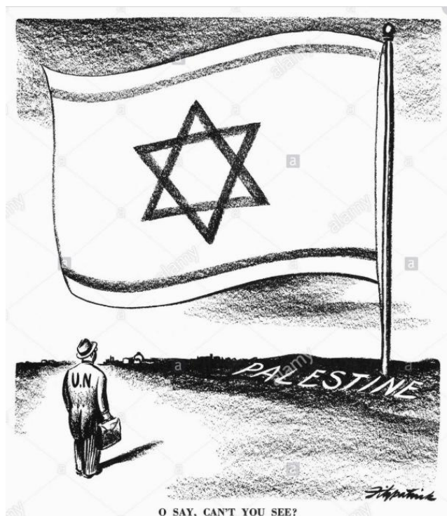
Création d'Israël, 1948. Caricature américaine de D.R. Fitzpatrick, 1948