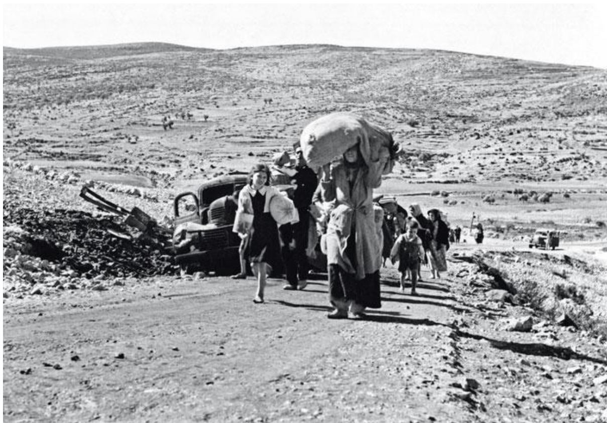
Exode de Palestiniens après le massacre de Deir Yassin (avril 1948).