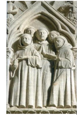
▲ Moines en prière, XIII ème siècle. ▲ Bernard de Clairvaux, moine et intellectuel cistercien, manuscrit du XIII ème siècle. ▼