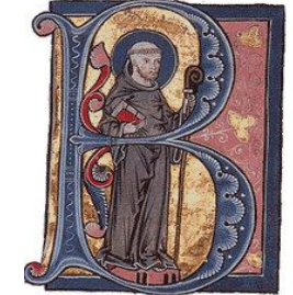
▼ Moine et convers défricheurs, enluminure du XII ème siècle (manuscrit de Cîteaux).