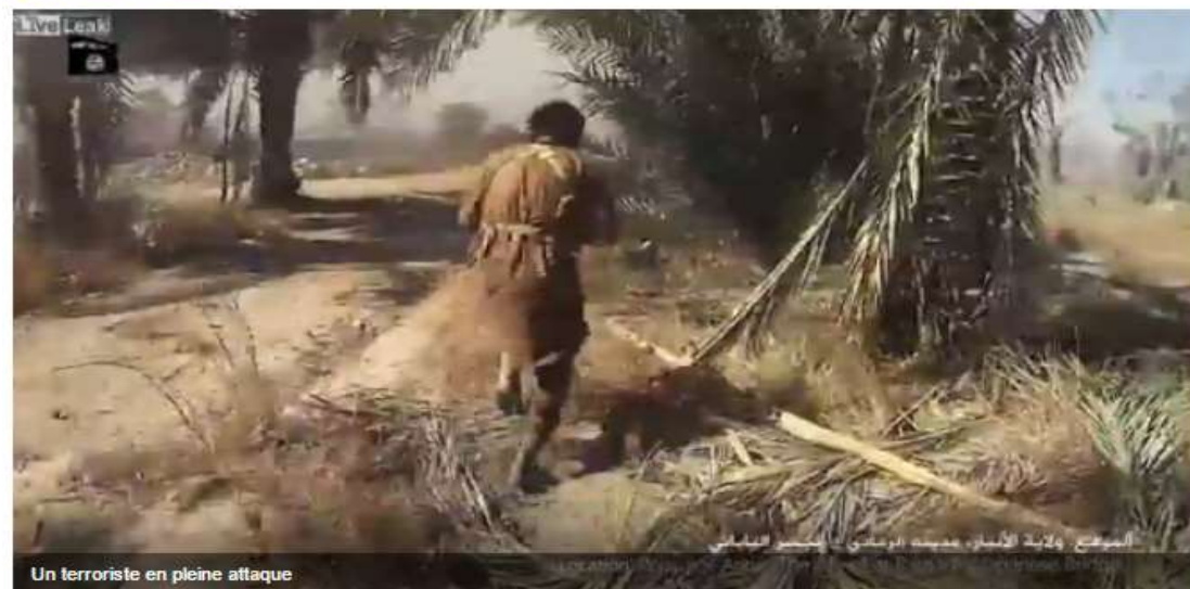
Un terroriste en pleine attaque