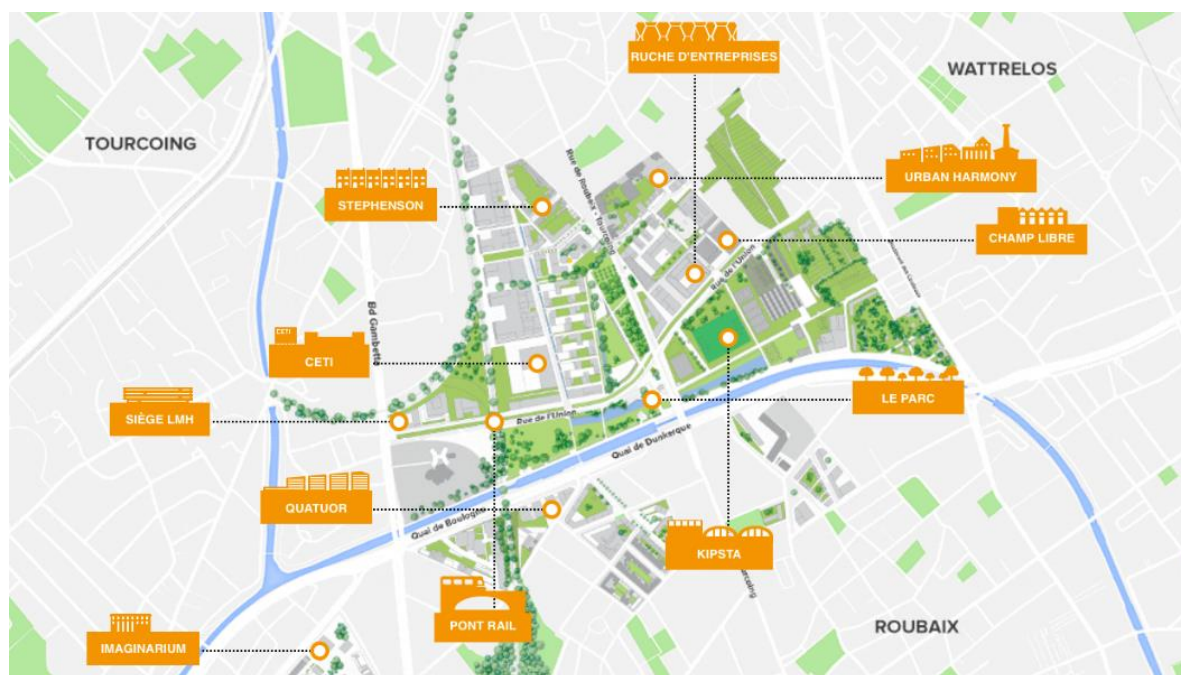
Carte interactive des secteurs d'aménagement de l'Union.

En salle multimédia, à partir du site Internet de l'Union, il s'agit de découvrir les objectifs d'un projet d'aménagement né en 2007 sur une superficie de 80 hectares : la reconversion d'un espace marqué par le passé industriel textile en un écoquartier mêlant habitations et pôle d'excellence économique. Il s'agit aussi de repérer les différents secteurs d'aménagement d'après la carte du site (cf. document 1).