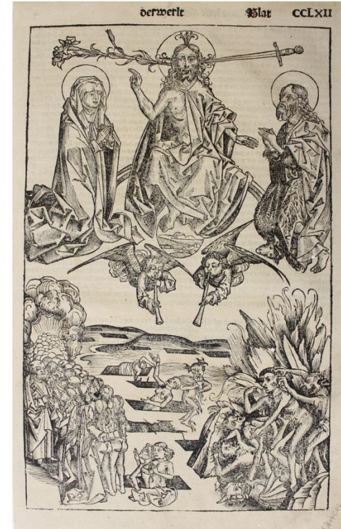
WOLGEMUT Michel Le jugement dernier Chronique de Nuremberg de Hartman Schedel, folio CCLXII,. 1493

http://www.musenor.com/vt/durer/pages/p1/stjean.htm