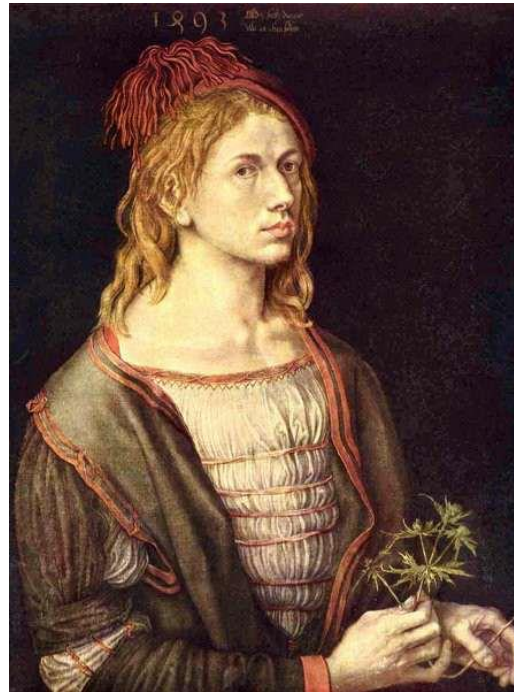
Albrecht DÜRER (Nuremberg, 1471 - 1528)

« Si Dieu me permet d'approcher le docteur Martin Luther, je ferai son portrait avec soin e le garderai sur cuivre afin de perpétuer le souvenir de cet homme chrétien grâce auque je suis sorti de grandes angoisses »