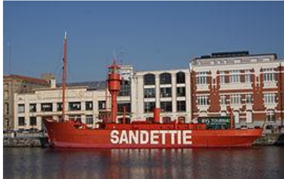
Le bateau feu dans le bassin du commerce Dunkerque