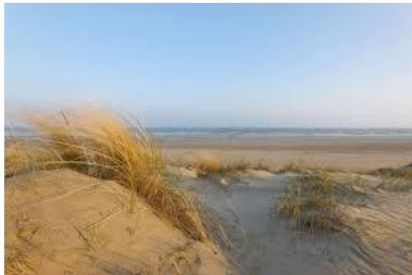
La plage de Dunkerque