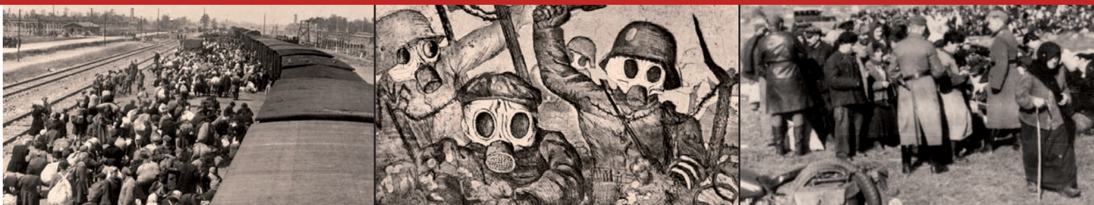
© Image principale / Souvenir d'un petit réfugié : ce que j'ai vu. Prise du village de Bousois le 27 août 1914 (Nord) Élève Debievre - Coll. Le Vieux Montmartre