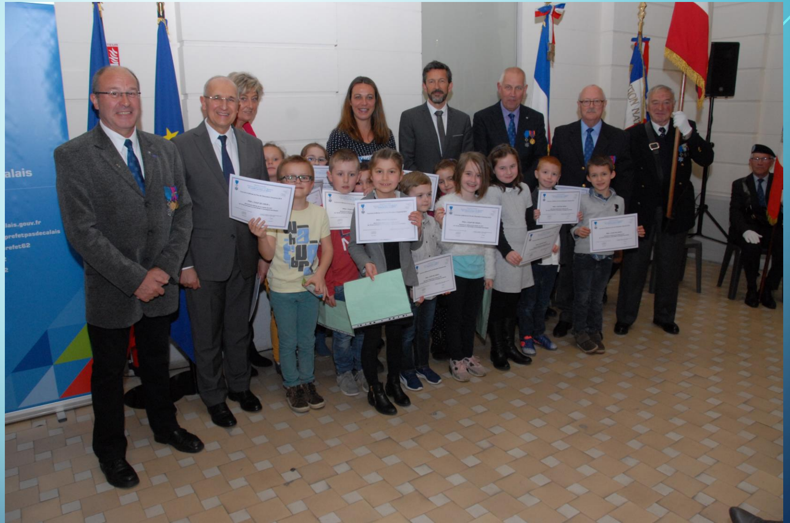
3 ème PRIX AFFICHE « COUP DE COEUR » : École de CAMPAGNE-les- HESDIN 24 élèves de CE1 (7 ans) avec un professeur des écoles Faire appel aux valeurs de la République, à la construction d'une culture civique dans une activité artistique (la formation de la personne et du citoyen est au programme)