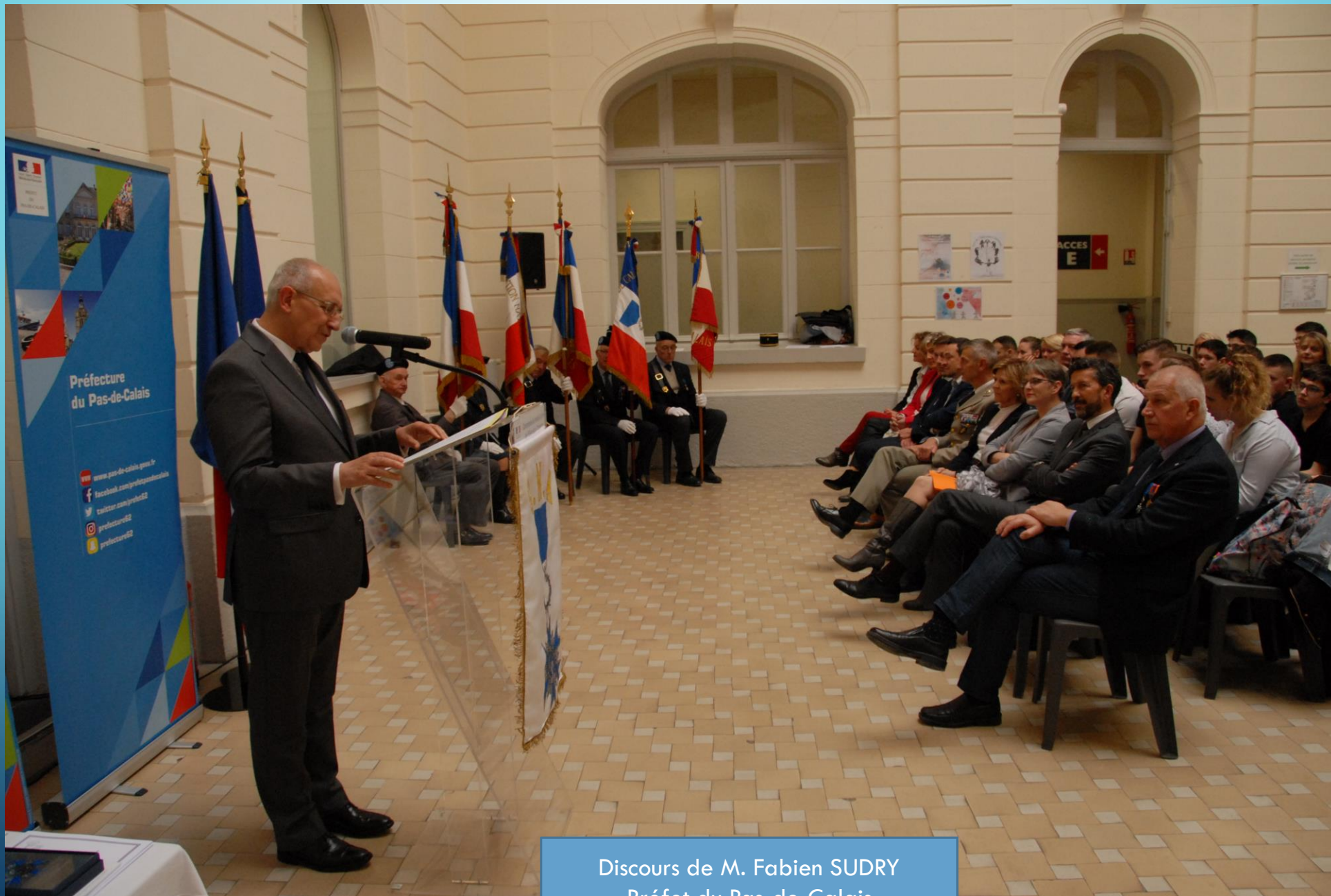
Discours de M. Fabien SUDRY Préfet du Pas-de-Calais