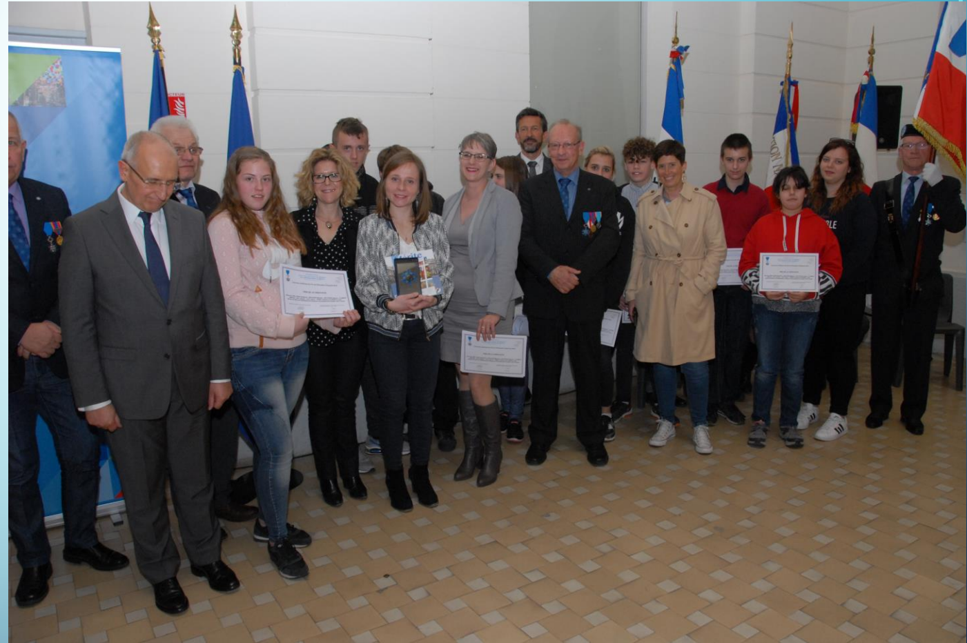
2ème PRIX AFFICHE « CREATIVITE » : EREA Côte d'Opale de CALAIS 8 élèves de 4ème (13-14 ans) avec 2 professeurs des écoles spécialisés Concours présenté par un professeur aux élèves, aussitôt partants. Recherche de mots, de définitions autour de la citoyenneté. Pour illustrer, un arbre