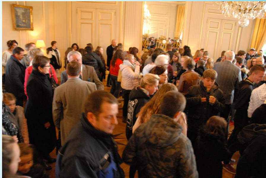
Collation dans les Salons de la Préfecture